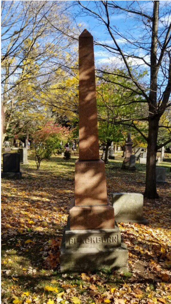
La tombe de Thornton Blackburn.

D'autres ont brisé bien des barrières. Comme William Peyton Hubbard, le premier conseiller municipal noir à être élu de 1894 à 1914.