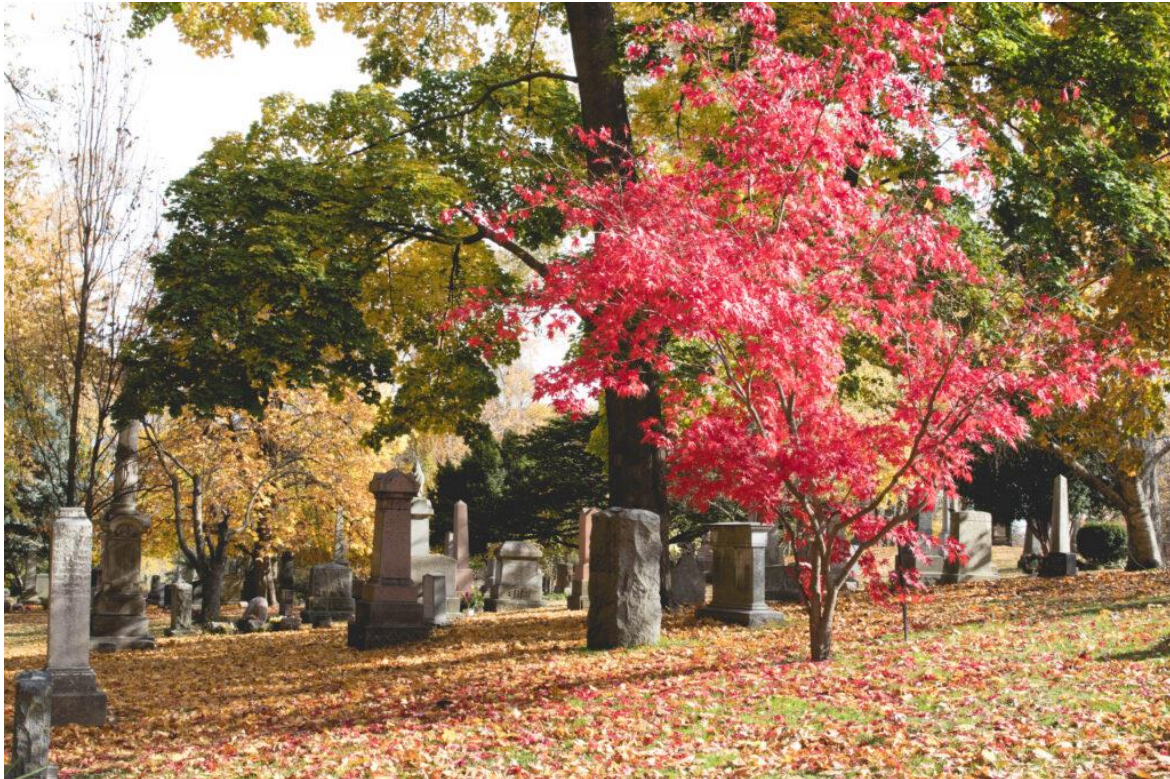
La Nécropole de Toronto est aussi un magnifique boisé.

I-express.ca remercie ses partenaires. En devenir.