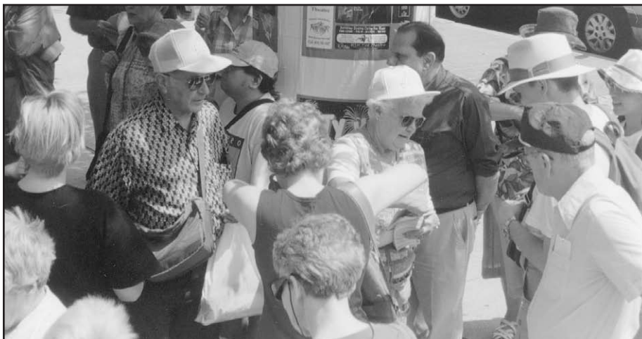
7 mai 2000