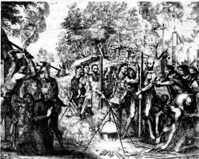
Martyre de Jean de Brébeuf, s.j., le 16 mars 1649.

1642-1649 – Martyre des missionnaires jésuites.